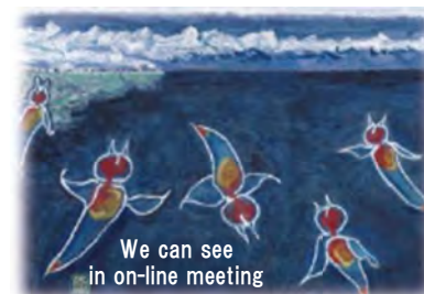
'Sea ice at Mombetsu' painted by Takao Nakajin