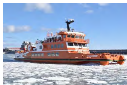
新型砕氷観光船:ガリンコ号Ⅲ