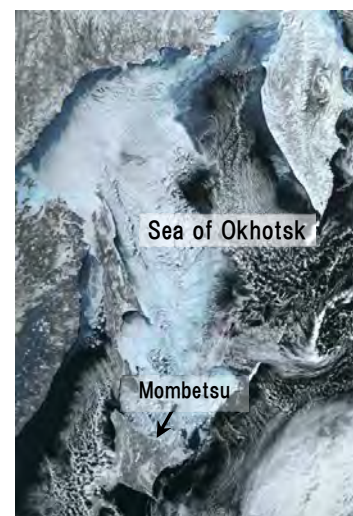
Satellite image of the Sea of Okhotsk