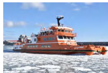
Sightseeing Icebreaker Garinko III (new in 2021)

If you want to make a workshop, submit its title and contents.