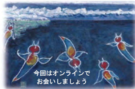
流水下で乱舞するクリオネ(中陣隆夫 画)